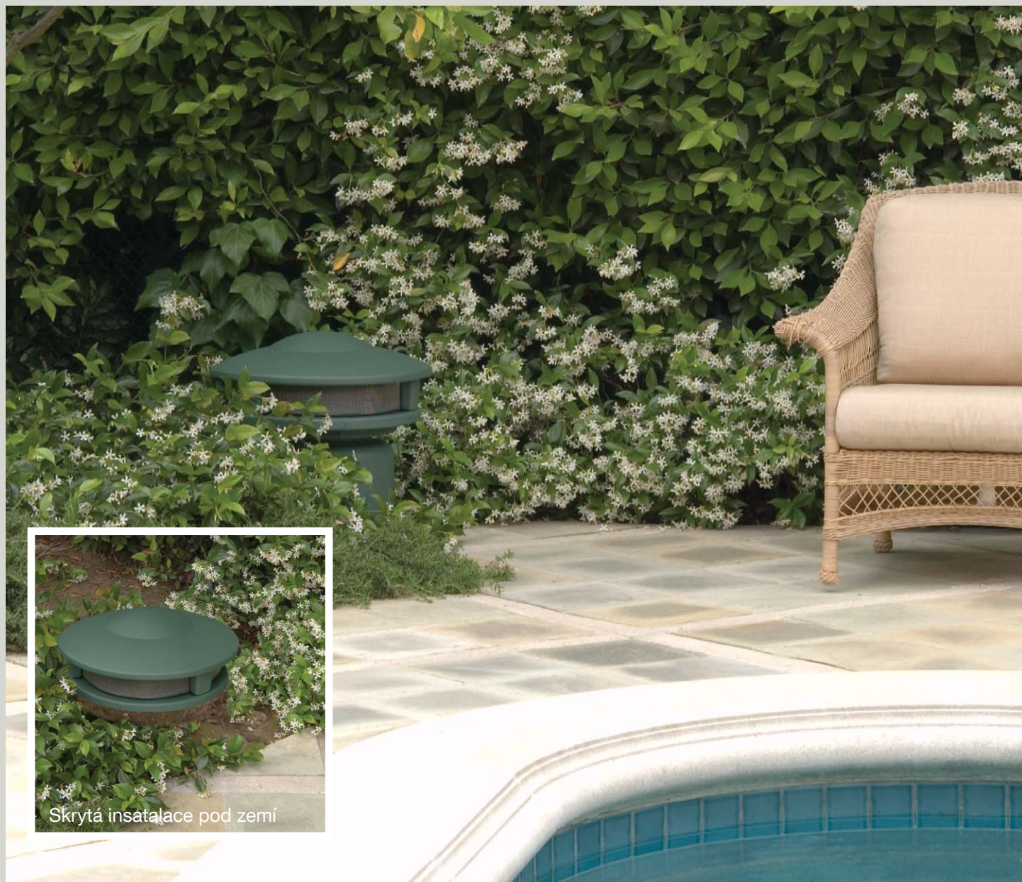
Skrytá instalace pod zemí

Doplňte svůj venkovní hudební zážitek se subwoofery AC.SUB a oceňovanými reproduktory řady AC. Užijete si kvalitní hudbu na své zahradě, v bazénu či sauně, tak jak byste jste nikdy nečekali.